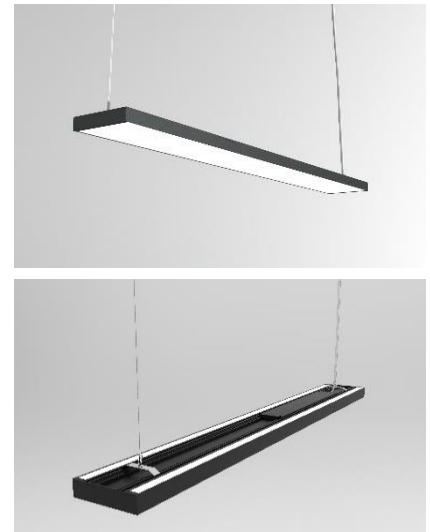
Vaizdas iš šviestuvo šono | Side view

EN | A slim suspended luminaire in extruded aluminium with moulded aluminium end caps. Direct or direct-indirect light distribution. Wide illuminating surface with microprism diffuser provides maximum visual comfort. Integrated sensor for presence and daylight available for optimized energy savings. Optionally the luminaire is available with integrated LED emergency light. Standard colours: white, black and grey, other colours available on request. Non-standard luminaire lengths available. Light colour temperature 3000K, other colour temperatures available on request. Colour rendering CRI > 80, colour tolerance MacAdam 3. DALI dimmable. Lifetime 50 000 h (L80/B10). Protection degree IP20.